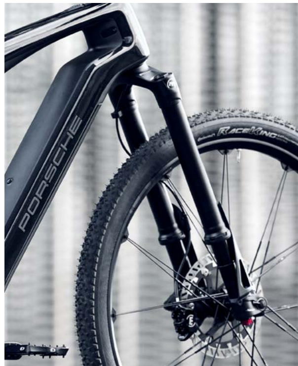
Porsche eBike Sport WAP066EBTOR00S (S) WAP066EBTOR00M (M) WAP066EBTOR00L (L)